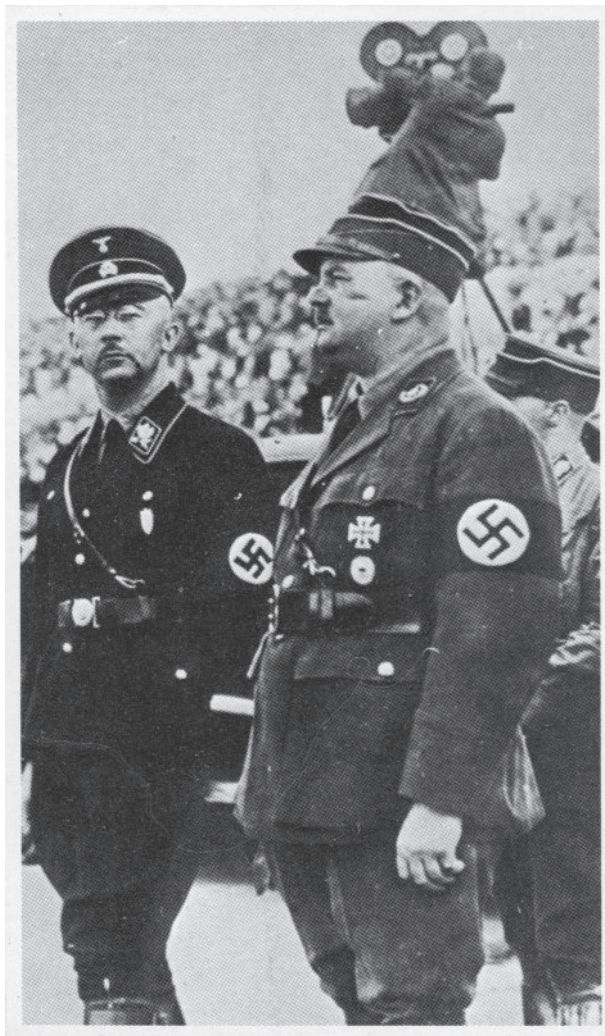
Os dois nazismos inimigos. Himmler (à esquerda), chefe das SS, e Roehm, chefe das SA, lado a lado em 1933