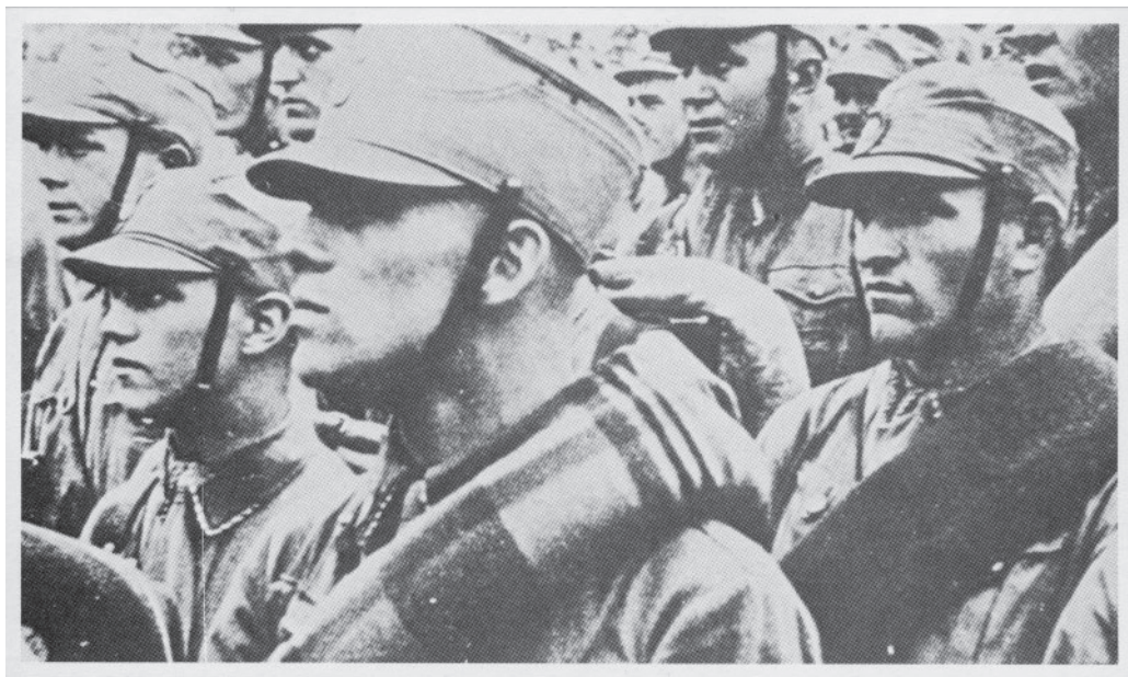
A onda castanha. A enorme, heteróclita população das SA, em 1933