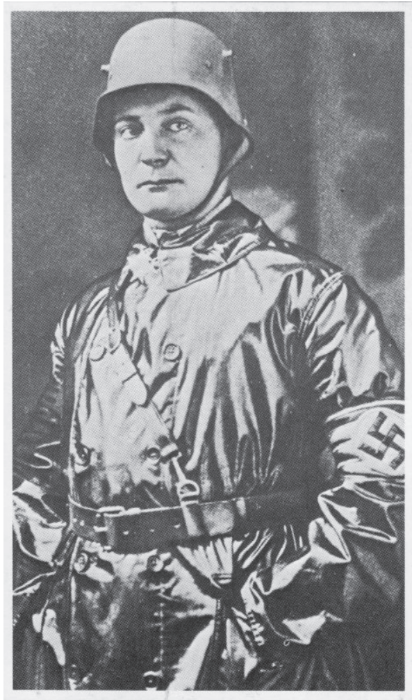
Hermann Goering, em 1923, primeiro chefe das SA

Roehm não deixa de fazer lembrar o reconhecimento que lhes é devido: «Os batalhões castanhos foram a